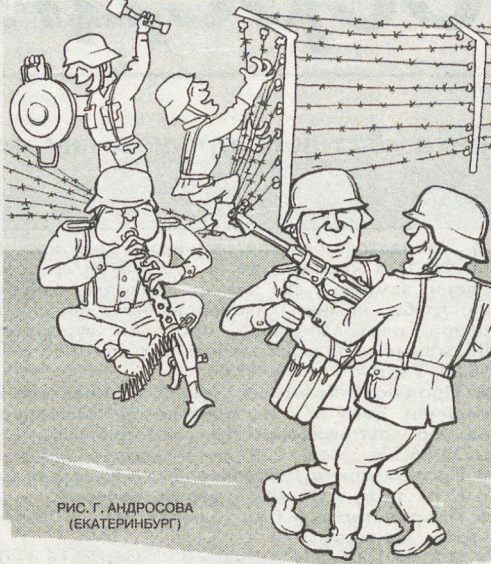
РИС. Г. АНДРОСОВА (ЕКАТЕРИНБУРГ)

Танец пожилых итальянцев. Плавный, медленный танец под бодрую музыку. Танцующие, вспоминая, какими веселыми и бойкими они были в молодости, выделывают скрипящие коленца. Перед танцем и в процессе его танцпол посыпается песком.