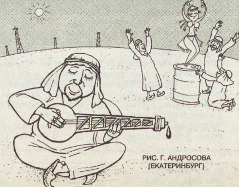
РИС. Г. АНДРОСОВА (ЕКАТЕРИНБУРГ)

В отличие от невинного танца живота, когда танцовщица демонстрирует живот и булькает его содержимым, исполнительницы Танца Головы бесстыдно обнажают самое сокровенное — голову и лицо, а также пикантные волосы на голове и лице. Ритмичное потряхивание головой, хлопанье глазами и потряхивание щеками доводят зрителя до экстаза.