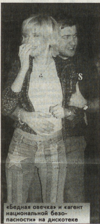
«Бедная овечка» и «агент национальной безопасности» на дискотеке