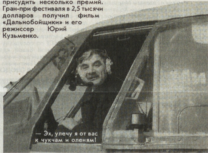
— Эх, учелу я от вас к чукчам и оленям!