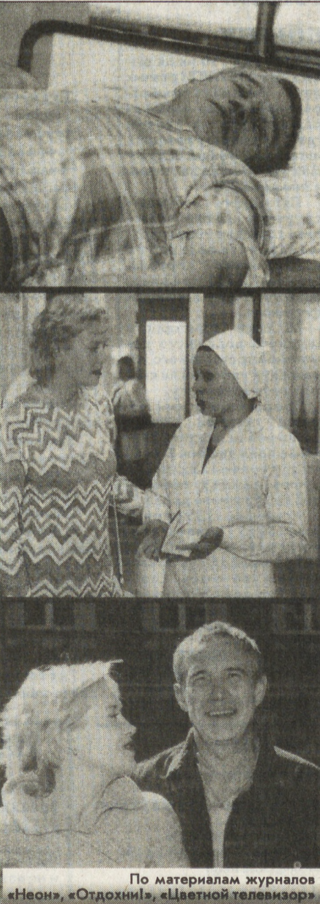
По материалам журналов «Неон», «Отдохни!», «Цветной телевизор»

Ну, если даже Месхиев... А вот и он. Докурил, пошел снимать дальше. Снова больница, палата, Гармаш лежит, Розанова стоит. Все молчат. Стоп! Снято.