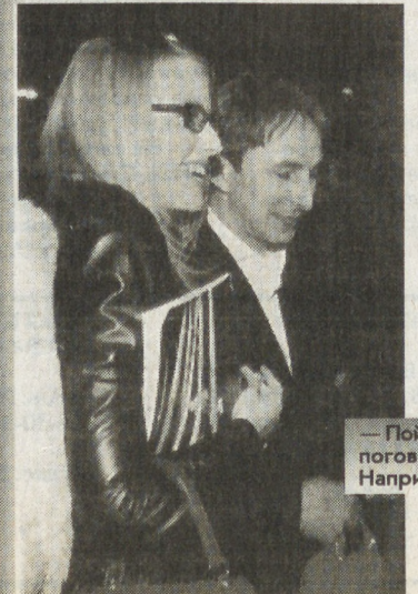
— Пойдем, Умарчик, поговорим о высоком. Например, о суши...

— По характеру я больше похожа на маму. Я часто иду на конфликт. Если мне нахамят или что-то не так скажут, у меня начинается жуткая агрессия. Свои права отстаиваю до последнего. Если мне нахамят, я могу очень жестоко ответить. Когда нужно — и маме.