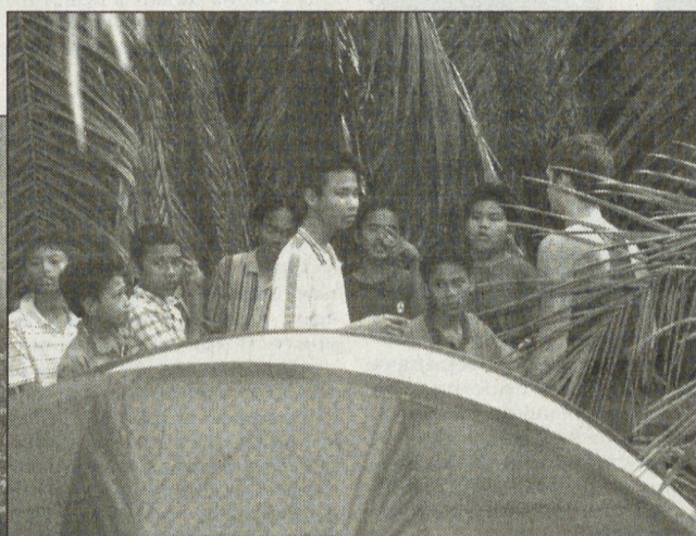
Проезжаю мимо чьей-то жизни, а узнать про нее подробнее не получается.

Когда обратно прилетела, очень обрадовалась: снег! Сразу на лыжах покатаюсь заotella. Еще соскучилась по картошке. Пожаловалась на это своему другу, и дома меня ждала жареная картошка.