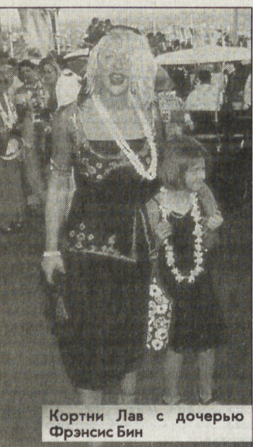
Кортни Лав с дочерью Фрэнсис Бин