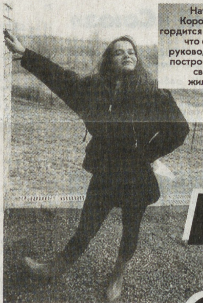
Наташа Королева гордится тем, что сама руководила постройкой своего жилища

В иктор Павлов при каждом удобном случае с удовольствием отправляется в Домодедово, где у него есть небольшой участок, сад и даже домик для кур. А еще на дачном участке Павлова растут все нужные и вкусные травы: укроп, петрушка, лук, салат, чеснок и другие. А в саду — яблони, красная и черная смородина. Каждый год актер собирает солидный урожай различных плодов и ягод и даже делает вместе с семьей заготовки на зиму.