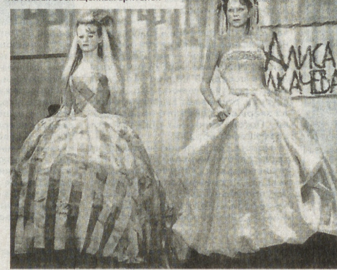
Чудо превращения происходило на глазах восхищенных зрителей

Прически напоминали одновременно и перья птиц, и нарядные шляпки. Здесь не было ярких цветов, не звучало бравурных маршей. Печаль и таинственные девушки появлялись в мерцании серебра и свечении тонких прозрачных тканей. Основные оттенки — серый, золотой, шоколадный. В сказочной коллекции нашлось место и средневековому корсету, кринолину, и деревенским английским длинным юбкам с турниром конца века, современным топам, брюкам, элегантным приталенным платьям и да ультрамодной «платформе» и юбке-баллону. Казалось, что придуманная Алисой Толкачевой в соавторстве с Андерсеном героини не только постепено, прямо на глазах зрителей, превращались из лебедей в принцесс, и легко преодолевали долгий путь из века в век, из прошлого в будущее.