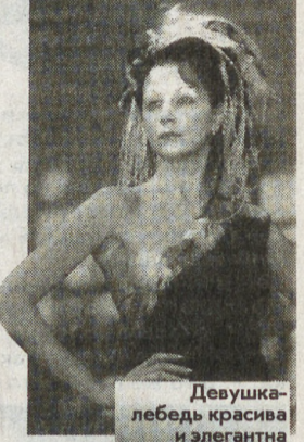
Девушка-лебедь красива и элегантна