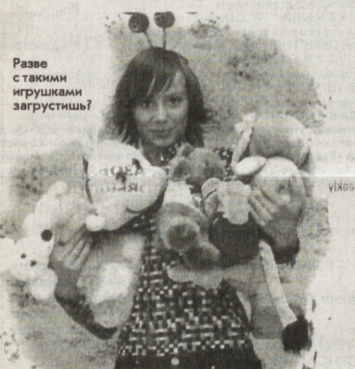
Разве с такими игрушками загрузишь?