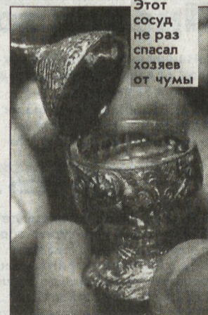
Этот сосуд не раз спасал хозяев от чумы

искусно замаскированных ювелирами, знатные дамы и кавалеры хранили нюхательные соли, способные вернуть к жизни потерявшую сознание чувствительную особу.