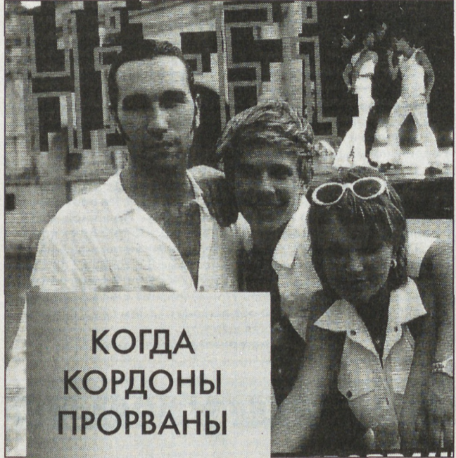
КОГДА КОРДОНЫ ПРОРВАНЫ

Для «HI-FI» фэнам не жалко ничего, даже фланелевых трусов