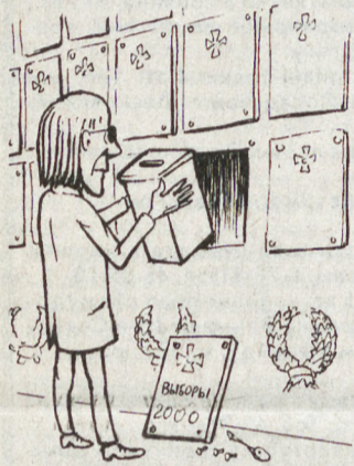
РИС. Г. АНДРОСОВА (ЕКАТЕРИНБУРГ)

В целом претенденты на губернаторство вели себя дисциплинированно: все они вовремя представили в Облизбирком видеокассеты с компроматом на своих конкурентов. Избирком разрешил использовать компромат в ходе кампании. Только кассеты с участием кандидата Рукоусуйкина и двенадцати голых женщин были отклонены из-за плохого качества и дубляжа почему-то на немецком языке.