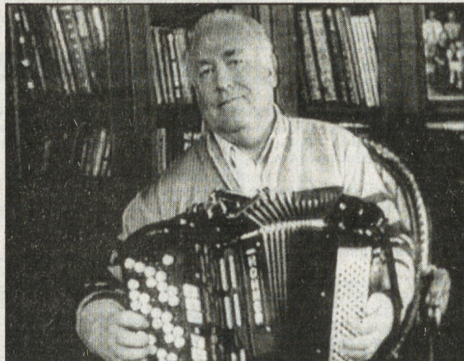
Многие популярные артисты приехали поддержать кандидатов.

Впрочем, всем было очевидно, что за его спиной стоит дружная и профессиональная команда имиджмейкеров.