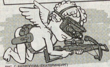
РИС. Г. АНДРОСОВА (ЕКАТЕРИНБУРГ)

Разогрею на завтрак котлету, Тихо чаю в стаканы налью... Пусть ума в голове твоей нету, Но тебя без ума я люблю!