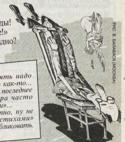
РИС. В. БАЛАБАСА (МОСКВА)