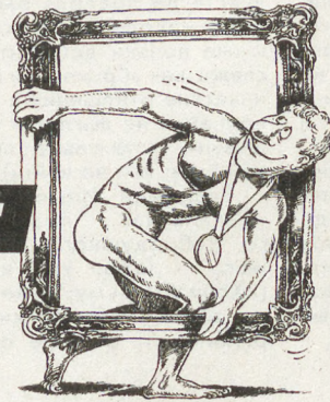
Рис. Максим СМАГИН