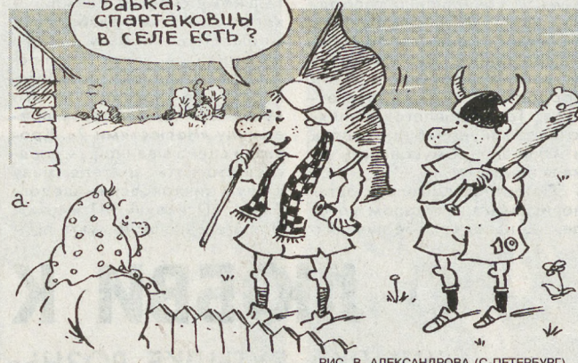
РИС. В. АЛЕКСАНДРОВА (С-ПЕТЕРБУРГ)

«Ну, что ж поделаешь. Это игра. И столкновения в ней неизбежны. Столкновения неизбежны, ушибы, травмы. Но ведь тем и прекрасен футбол!»