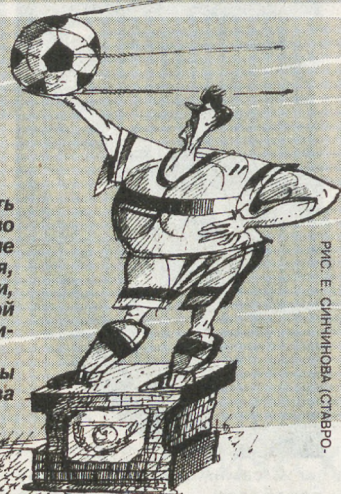
РИС. Е. СИННИКОВА (САНКТ-ПЕТЕРБУРГ)

«Вот как бразильцы стоят и поют свой гимн! Приятно ведь смотреть! Нечасто увидишь, как наши футболисты точно так же исполняют гимн своей страны. (Кому-то в сторону.) А? (Опять в микрофон.) К тому же, как мне тут подсказывают, оно и понятно — в нашей гимне пока и слов нету».