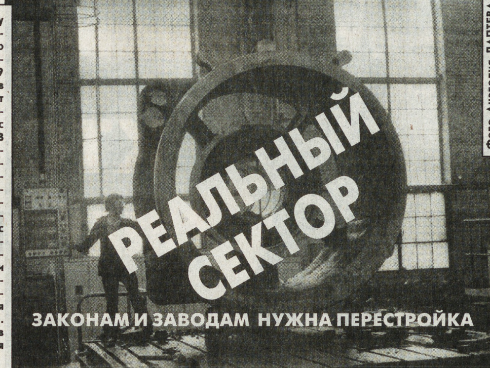
ЗАКОНАМ И ЗАВОДАМ НУЖНА ПЕРЕСТРОЙКА

И все-таки обзор ситуации на предприятиях машиностроительного комп-