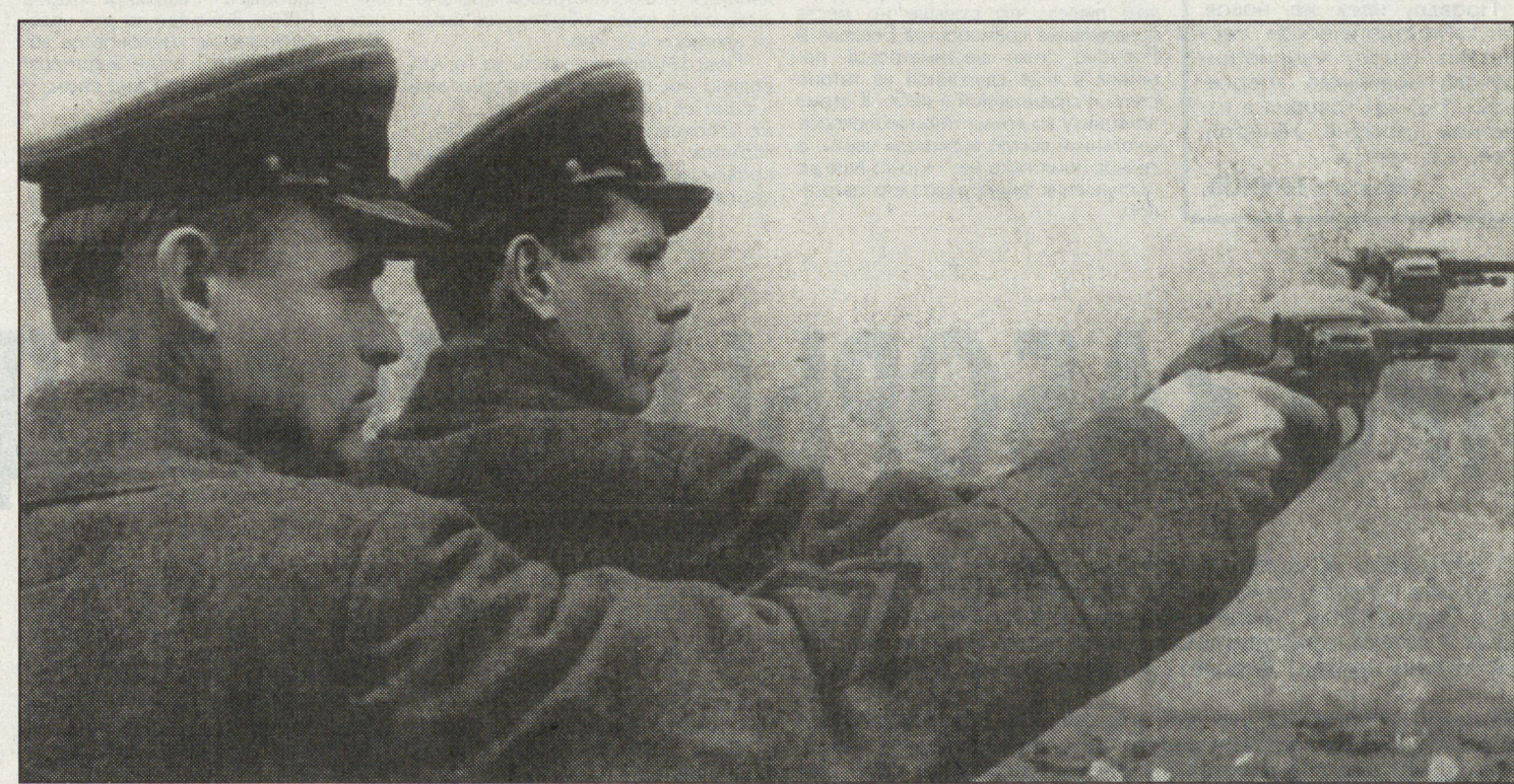
Снимок из 30-х: советские чекисты тренируются. Тогда система контроля в стране была простой и надежной, как наган.

В чем же дело? А в том, что и до, и после революции власти делали основную ставку на принуждение и страх вместо того, чтобы «вносидать» позитивную социально-эконо-