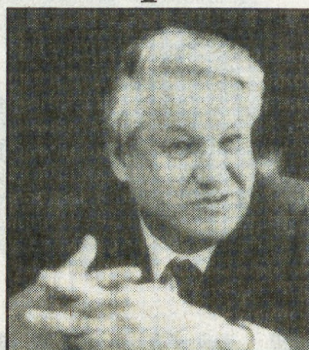
Президент РСФСР Борис Ельцин в 1991 году

ЕКАТЕРИНБУРГ. Эдуард Россель 31 января имел телефонный разговор с первым президентом РФ Борисом Ельциным, сообщил пресс-секретарь губернатора Э. Россель сердечное поздравил Бориса Николаевича с наступающим днем рождения и пригласил его посетить Свердловскую область. Б. Ельцин сердечно поблагодарил за приглашение и сообщил, что он намерен прилететь в Свердловскую область на неделю в третьей декаде февраля.