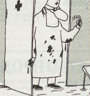
РИС. В. ШИЛОВА (С-П)

— Дорогие друзья, внимание! Сегодня, отвечая на ваши вопросы, Иод Заумович дал один заведомо неправильный совет. Тот, кто первым определит его и сможет написать нам об этом, получит приз. Кстати, приз может быть получен потом и вашими родственниками.