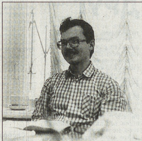
Не думал Володя, ратуя в 88-м за демократию, что демократия его посадит под замок...

13—14 октября по области ожидается переменная облачность, возможен кратковременный дождь; ветер юго-западный, 5—10 м/сек. Температура воздуха ночью — +4—9°, днем — +11—16°.