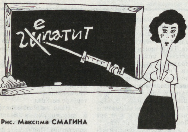
Рис. Максима СМАГИНА