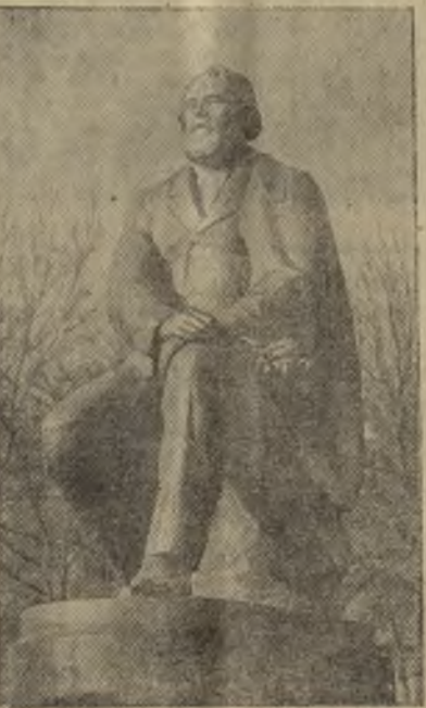
Советский народ и прогрессивная общественность всего мира отметили 150-летие со дня рождения великого русского писателя Ивана Сергеевича Тургенева. На снимке: памятник И. С. Тургеневу, открытый к юбилею писателя на его родине в г. Орле.