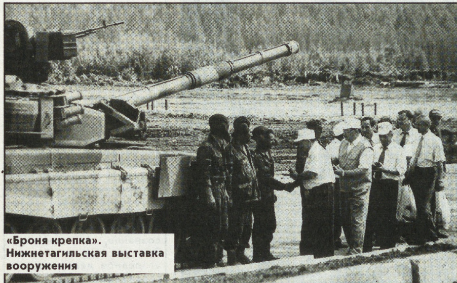
«Броня крепка». Нижнетагильская выставка вооружения