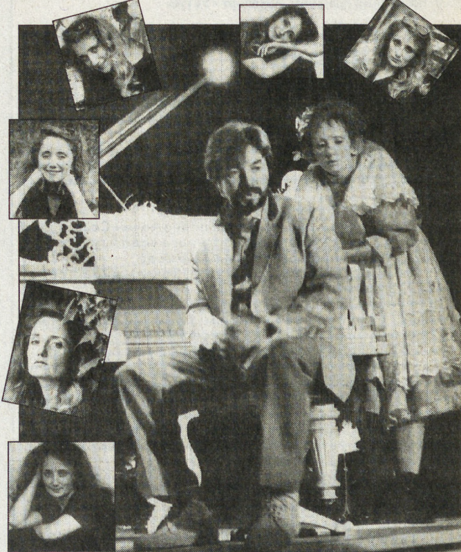
Беседовала Лариса БОЧАРОВА

— Если говорить об уровне заболеваемости, то временная утрата трудоспособности — так на профессиональном языке называется время, в течение которого больной находится на обследовании, — у нас не выше, чем в других регионах Рос-