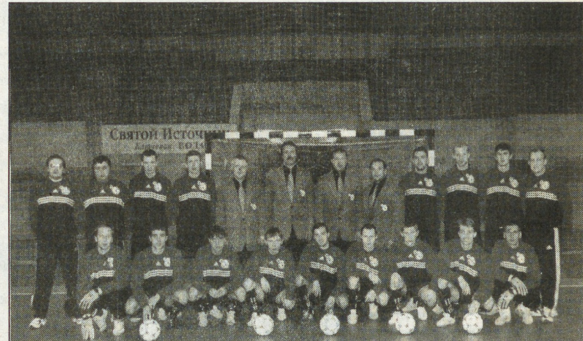
Святой Источек. Адрес: 6014