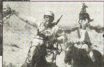
ОРДЕН БОЕВОГО КОСЫШКА

«...Ветер кружит мое голову» Мария-Антуанетта, воспоминания