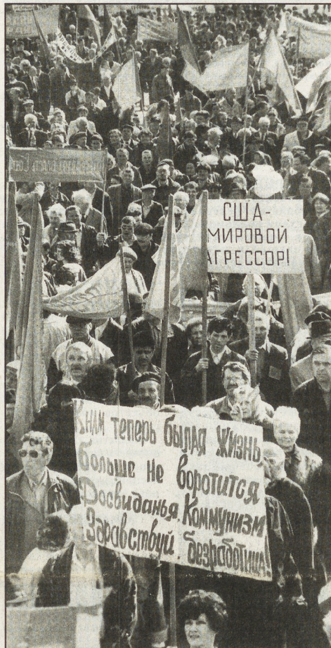
то время, как 30 апреля их было девять. Медики не исключают, что это одно из последствий первомайских торжеств. ЕАН Фото Анатолия ЛАПТЕВА