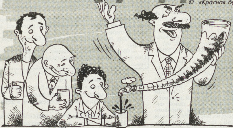
РИС. М. СМАГИНА (КЕЛТИНИНГРАД)

— Во-первых, хочется поднять тост за здоровье президента! Потому что это — актуально.