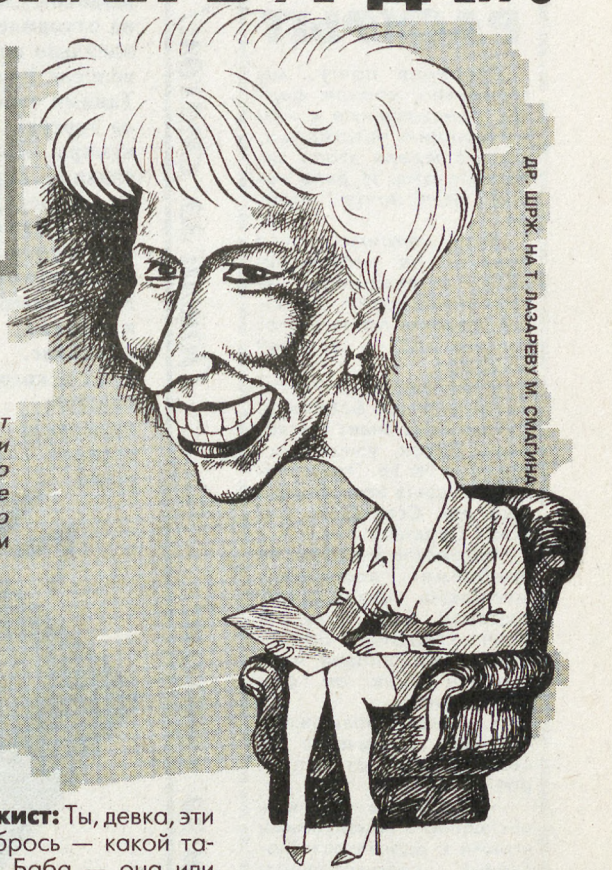
ДР. ШРЖ. НА Т. ДИДЗЕВУ. М. СМАГИНА

Вот Вы, Любозный Читатель, смотрите телевизор? И мы тоже нет. А ведь есть люди, которые не только смотрят ящик, но даже в нем работают! Одни из таких людей — работники передачи «О.С.П. - студия». Передачу они делают хорошую, только короткую. Не успеешь засмеяться как следует, а передача уже кончилась... Специально для тех наших Любозных Читателей, кто не успел засмеяться во время просмотра телевизора, мы публикуем текст одной из рубрик передачи «О.С.П. - студия». Смейтесь не спеша!