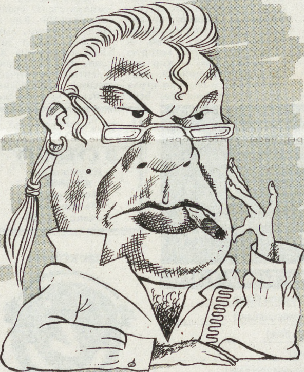
ДР. ШРЖ. НА С. РЫКОВА. М. СМАГИНА

Визажист: А они мне никакие не товарищи! Коллег своих по цеху ненавижу! Придешь в цех утром — тьфу, срамота. Схватишь