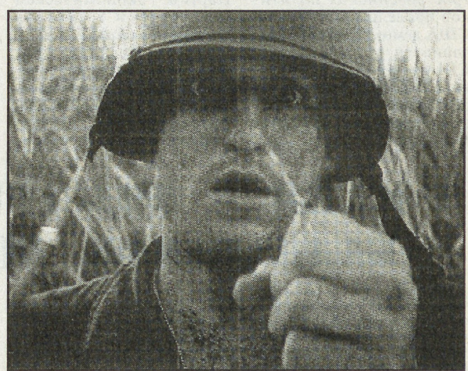
Вуди Харрельсон играет сержанта Кека, который геройски погибает в сражении

Но в том-то и дело, что победа — это условная величина, и такая победа абсурдна. Потому что убитыми своими руками человека — тяжкий грех, совершенный против собственной природы, и это горе — сумерки души — не перекроют ни муть, ни спирт. Солдаты после победы более страшны и менее человечны, чем под огнем: у них нет даже