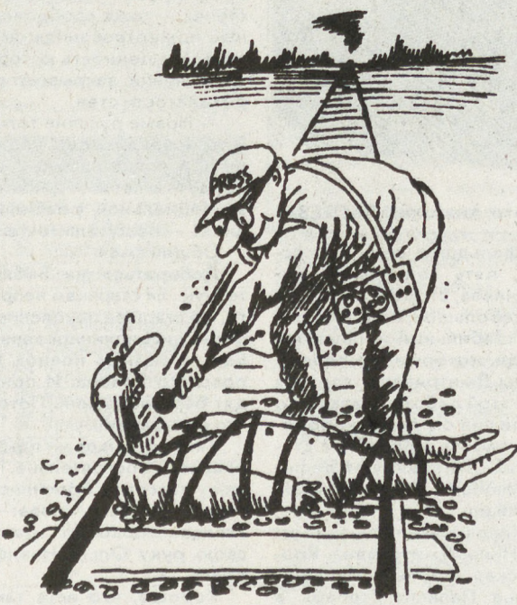
Рис. Виктора БОГОРАДА