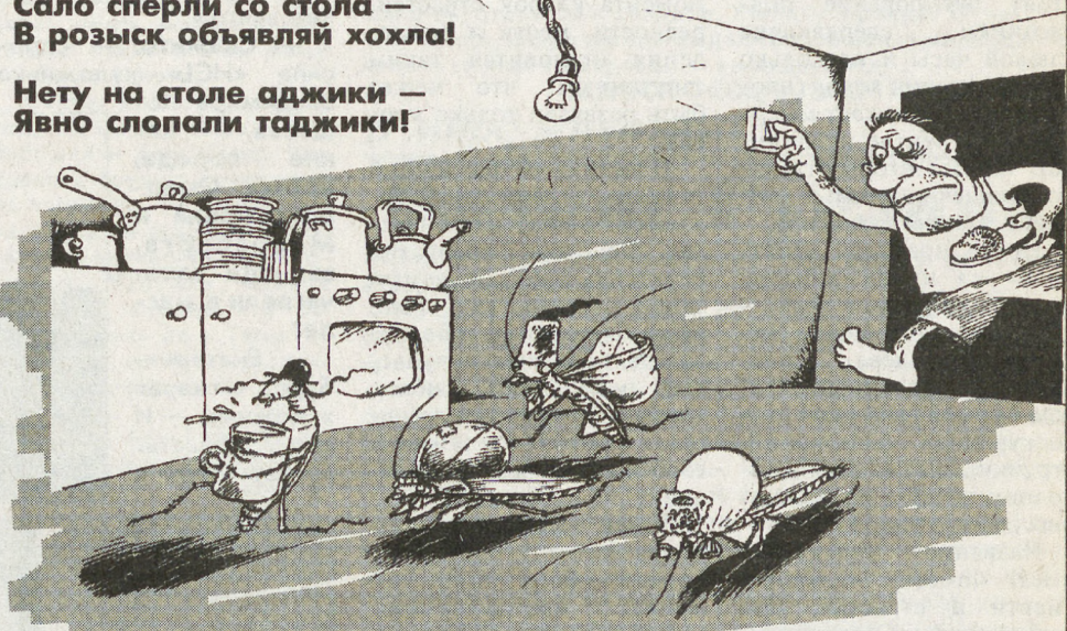
РИС. М. СМАГИНА (ЕКАТЕРИНБУРГ)

Если в доме нету ваты — То узбеки виноваты! (Басмачи из русской ваты Понаделали халаты!)