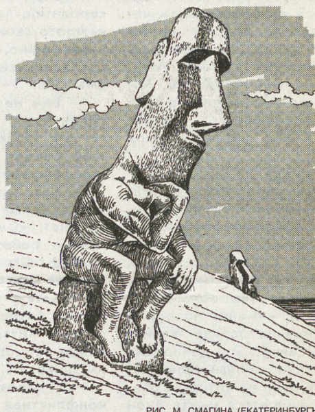
РИС. М. СМАГИНА (ЕКАТЕРИНБУРГ)