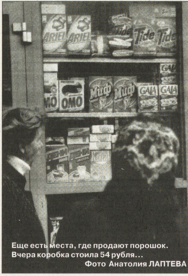
Еще есть места, где продают порошок. Вчера коробка стоила 54 рубля...