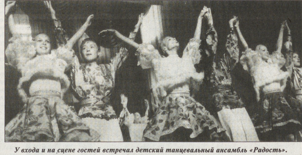
У входа и на сцене гостей встречал детский танцевальный ансамбль «Радость».