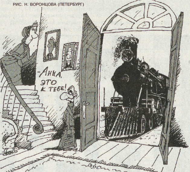
РИС. Н. ВОРОНЦОВА (ПЕТЕРБУРГ)

УЧРЕДИТЕЛИ: Предприятие «Уралтрансгаз» РАО «Газпром» Свердловский областной комитет по управлению государством Российский Союз Молодежи Физические лица