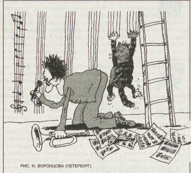
РИС. Н. ВОРОНЦОВА (ПЕТЕРБУРГ)