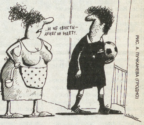
РИС. А. ПРЖАНКОВА (ГОРДИНО)