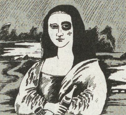
РИС. Л. МЕЛЬНИКА (С-ПЕТЕРБУРГ)

От Москвы до Парижа Король танца — Моисей! (Игорь)