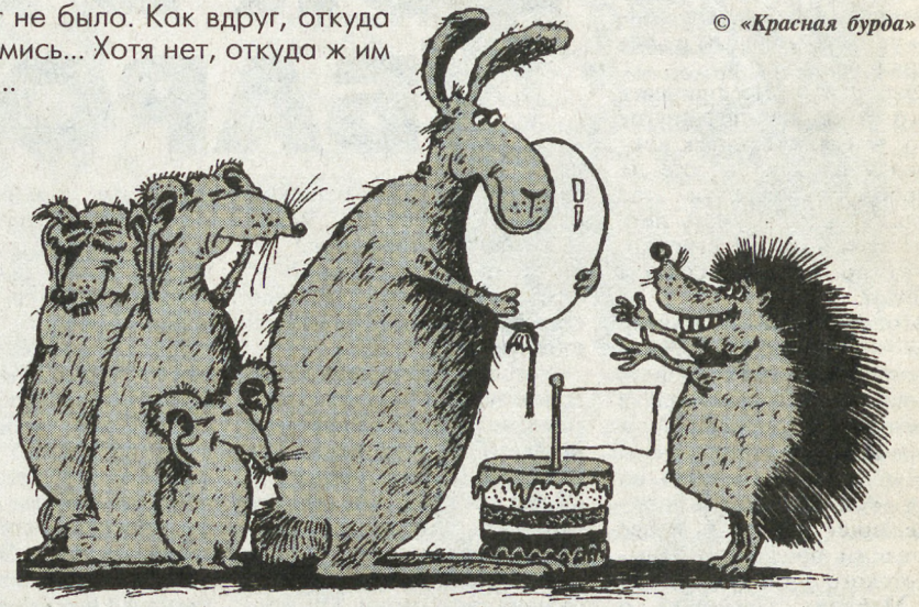
РИС. Л. МЕЛЬНИКА (ПЕТЕРБУРГ)