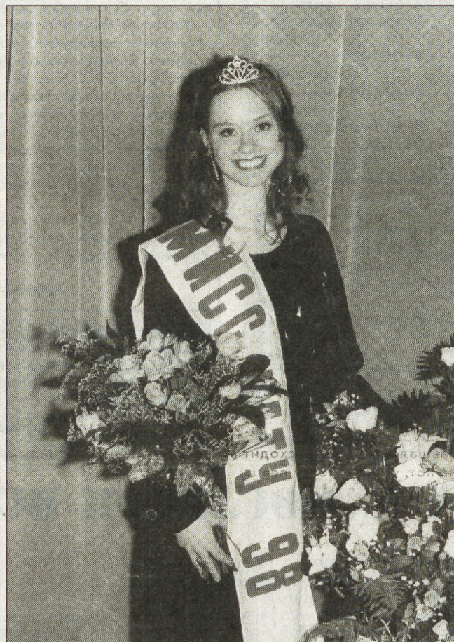
В рамках Российского студенческого фестиваля в УГТУ-УПИ прошли конкурсы «Мистер» и «Мисс Технический университет».