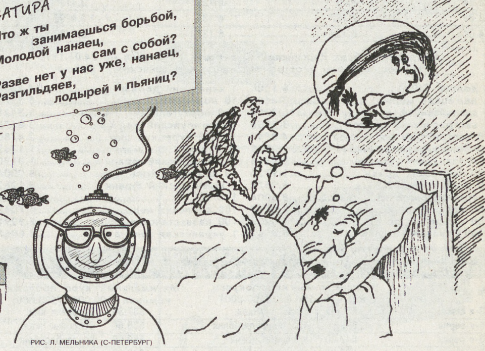
РИС. Л. МЕЛЬНИКА (С-ПЕТЕРБУРГ)

Михаил ВЕКСЛЕР САТИРА Что ж ты занимаешься борьбой, Молодой нанаец, Разве нет у нас уже, нанаец, Разгильдяев, лодырей и пьяниц?