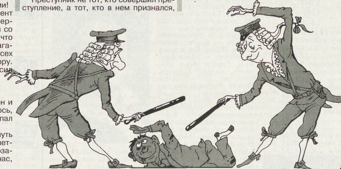
Рис. М. СМАГИНА (ЕКАТЕРИНБУРГ)