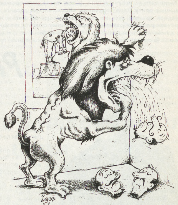
РИСУНОК И. ВАРЧЕНКО (МОСКВА)