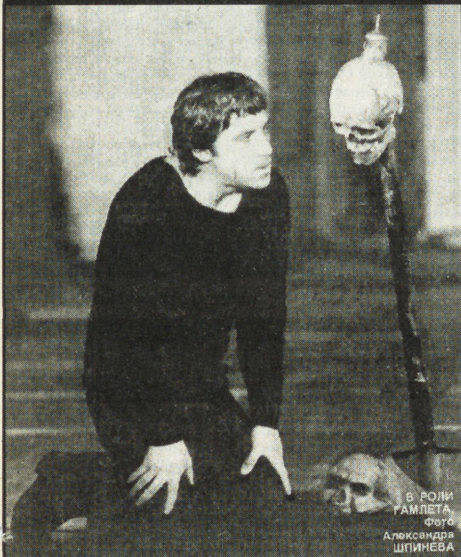
В РОЛИ ГАЙДЕТА