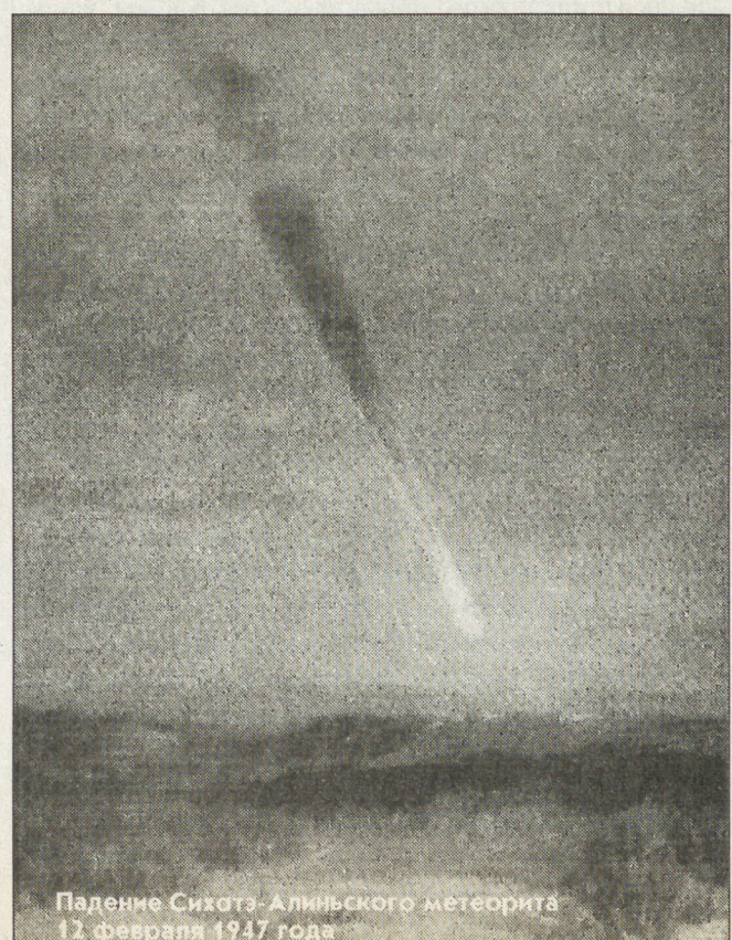
Падение Сихотэ-Алинского метеорита 12 февраля 1947 года