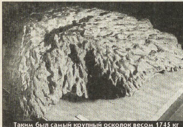
Таким был самый крупный осколок весом 1745 кг

Десять дней работали в районе падения Сихотэ-Алинского метеорита студенты и преподаватели метеоритной экспедиции, десятки лет назад созданной на физтехе УПИ.