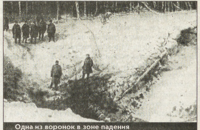
Одна из воронок в зоне падения