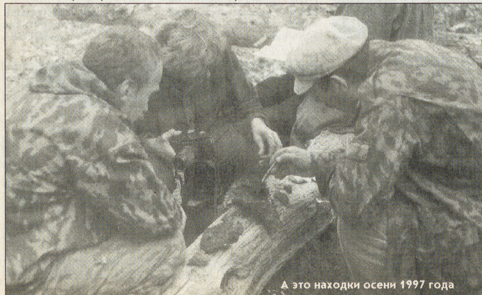
А это находки осени 1997 года