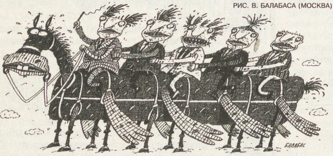
РИС. В. БАЛАБАСА (МОСКВА)