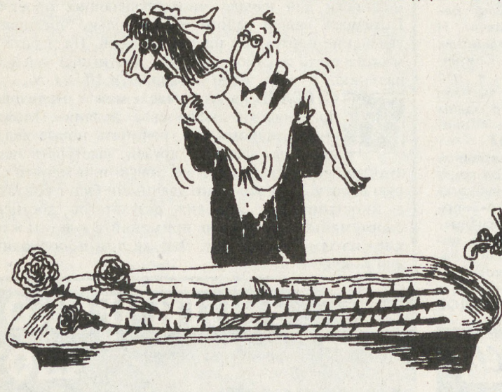
РИСУНОК В. БОГОРАДА (С-ПЕТЕРБУРГ)

«Ах так!» — подумала Люсьена и добавила от себя: — Президент Российской Федерации аннулировал постановление Государственной Думы, а депутата Иннокентия Храповицкого лишил депутатства за чертовой бабушке! Вот так-то, Кеша!.. После этого пошел прогноз погоды.