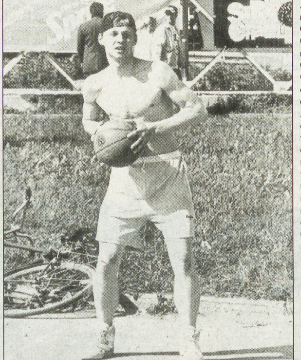
Юрий ОВODOV На снимках: это стритбол!

ХОККЕЙ С МЯЧОМ В Первоуральске завершился один из предвзятых турниров чемпионата России по ринк-бенди. Первое место и одну из восьми путевок в финал завоевала команда СКА (Екатеринбург), опередив-