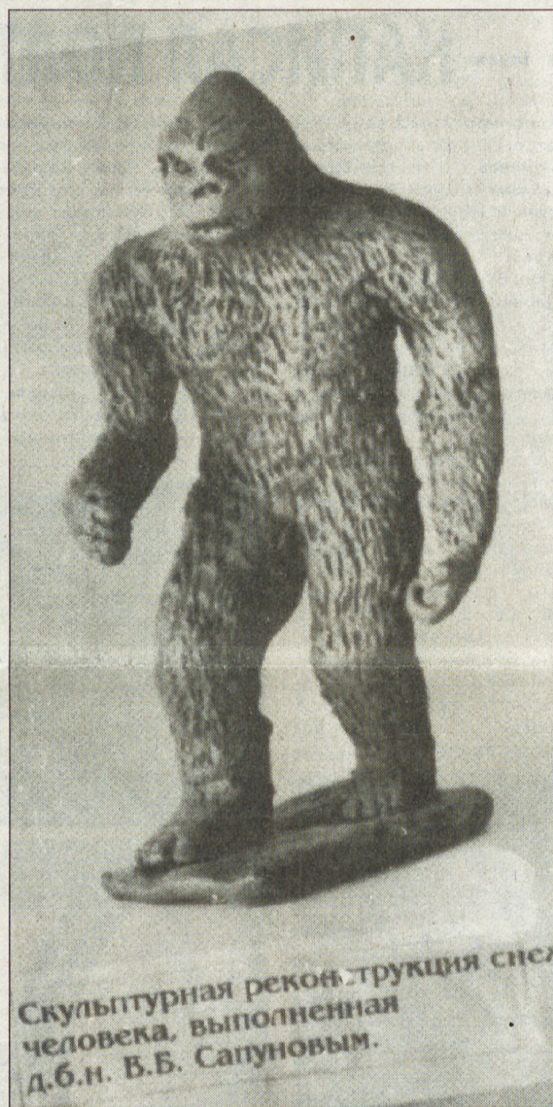
Скульптурная реконструкция лица человека, выполненная д.б.н. В.В. Сапуновым.

10 АВГУСТА ВЕЧЕРОМ В РОДИЛЬНОМ ДОМЕ ДЗЕРЖИНСКОГО РАЙОНА НИЖНЕГО ТАГИЛА У 22-ЛЕТНЕЙ ВИКТОРИИ АРТЕМЬЕВОЙ РОДИЛАСЬ ТРОИНЯ. ПОСЛЕДНИЙ РАЗ ТАКОЕ СОБЫТИЕ В КРУПНЕЙШЕМ РАЙОНЕ ГОРОДА ПРОИЗОШЛО ПЯТЬ ЛЕТ НАЗАД