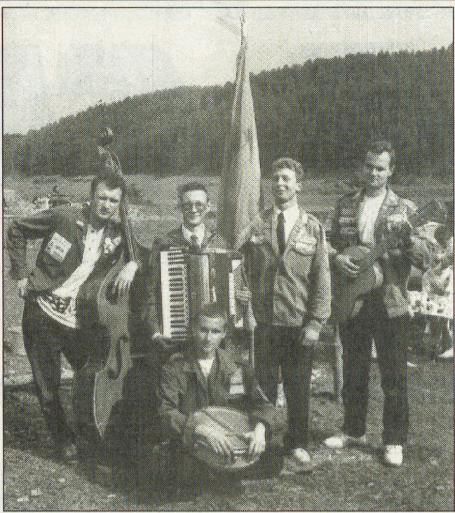
Уставшие лауреаты множества Знаменок, в том числе и этой.

Все хорошее почему-то заканчивается достаточно быстро. 20-ая Знаменка уже стала историей. Встретимся через год. Жанна КОРНЕТ