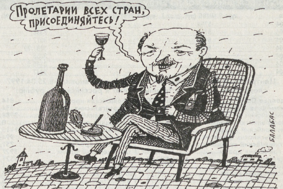
РИСУНОК В. БАЛАБАСА (МОСКВА)