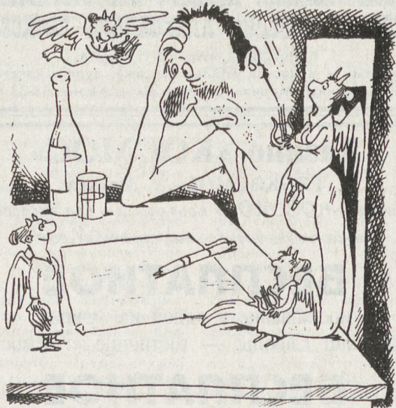
РИС. М. СМАГИНА (ЕКАТЕРИНБУРГ)

Свобода к нам пришла на шпильках, но без платья. А может быть, такой прозрачный матерьял... Чего нам с ним делить? Мы ж близнецы, мы братья! Я больше не пишу. А он и не читал.