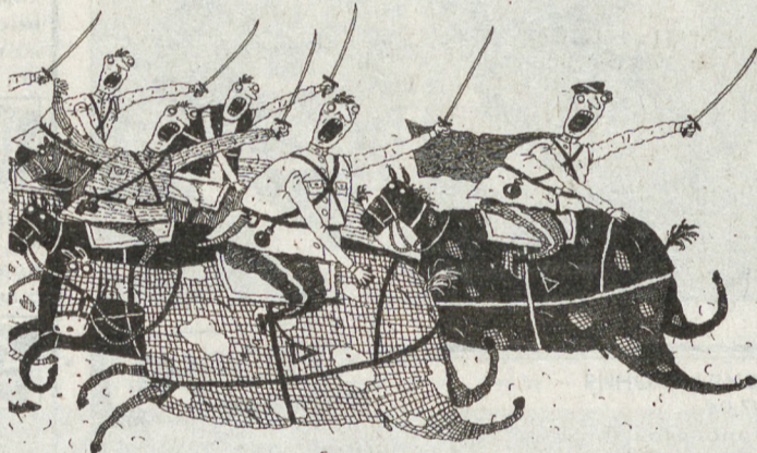
РИС. В. БАЛАБАСА (МОСКВА)

*** Переплыл полковник реку. Так что, если по уму, Отнеслись как к человеку Всё же красные к нему.