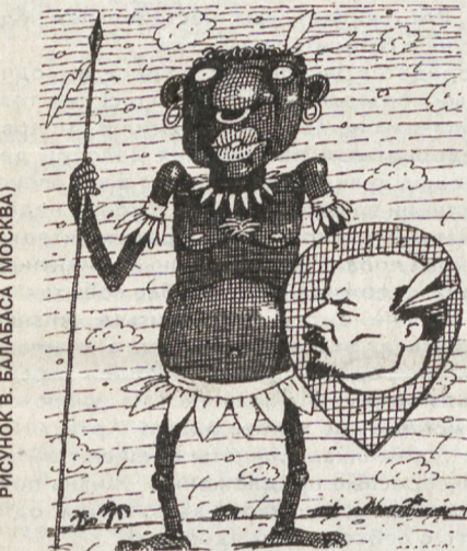
РИСУНОК В. БАЛАБАСА (МОСКВА)

*** Знаете, девушка Лена какая? Все мужики по ней страстно вздыхают. Только вздыхающим тем мужикам Девушка бьет по нахальным рукам. В поддых! Под ребра! Ногою им в пах! До изумленья! До мрака в глазах! Лупит по морде! Под зад их пинает! Вот она девушка Лена какая! Я восхищаюсь Еленой прекрасной Метров с пятнадцати. Ближе опасно.