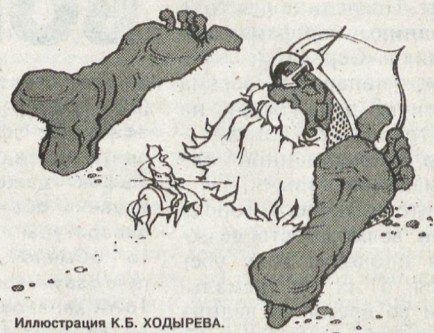
Иллюстрация К.Б. ХОДЫРЕВА.

Но, пишет Пушкин в стихах, ты еще пожалеешь, и поймешь, что такого искреннего, нежного и нормального пацана, ну типа вот как я, фиг найдешь.