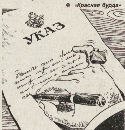
РИС. М. СМАГИНА (ЕКАТЕРИНБУРГ)