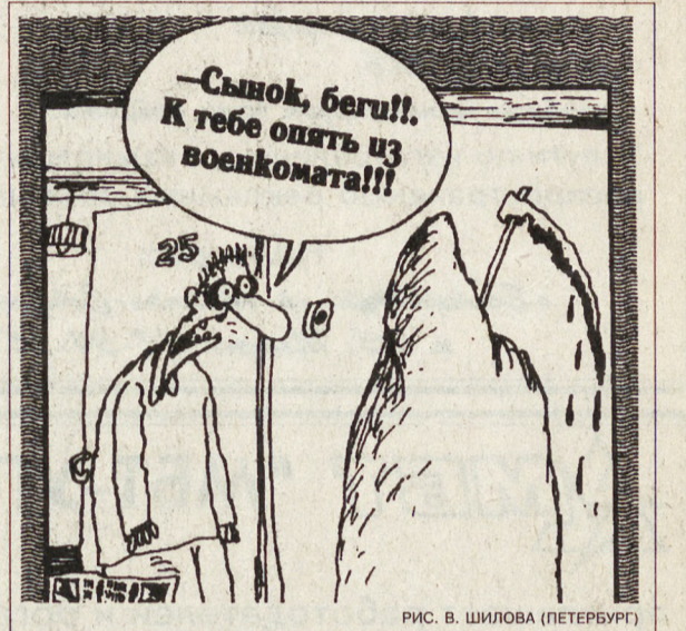
РИС. В. ШИЛОВА (ПЕТЕРБУРГ)

В МОСКВЕ ЗАРЕГИСТРИРОВАН «Союз пациентов», задача которого — помочь лицам, не желающим служить в армии. Адрес «Союза пациентов»: Москва, ул. Страстной бульвар, 12-а (в здании Московского городского военкомата). Обращаться к майору Бляблину.