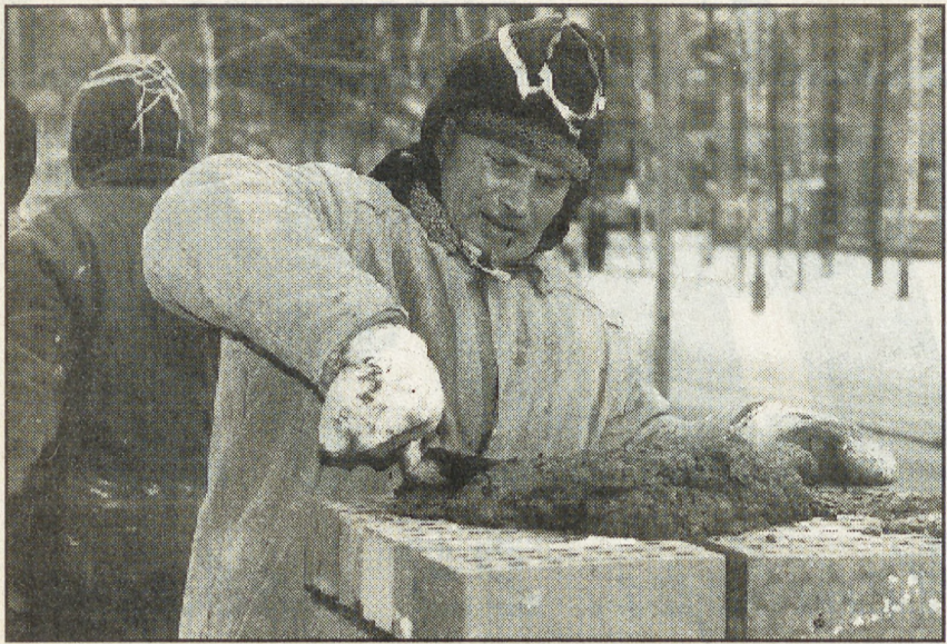
Строители многоквартирного жилого дома на улице Куйбышева, застеснявшиеся назвать свои имена, предложили вместо интервью купить в этом доме квартиры:

— Недорого — три миллиона за квадратный метр! Денег таких нет, говоришь? А вот люди целыми этажами скупают. О чем думаю с утра? Чтобы морозы поскорей кончались. И так за ноябрь и декабрь еще не выплатили, еще и холода замучили!