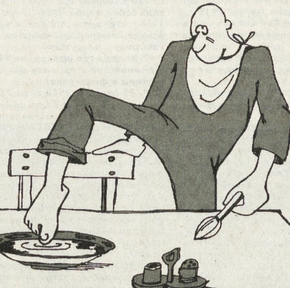
РИС. А. БЕЛОПОДА (ЕКАТЕРИНБУРГ)

Не секрет, что жизнь кипит не только в российской глубинке (в регионах), но и в столице страны. В Москве ведь тоже люди живут, пьют, кушают, реформы проводят... Вот и с культурным досугом в Москве тоже стало налаживаться!