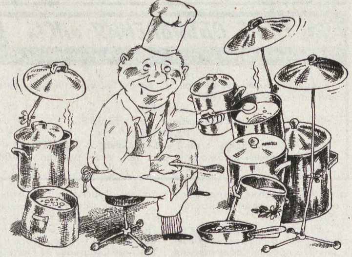
РИС. М. СМАГИНА (ЕКАТЕРИНБУРГ)