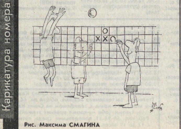
Рис. Максима СМАГИНА

Областное и городское ГАИ в канун начала учебного года проводит рейд «Внимание: дети!». Сотрудники ГАИ обращаются к водителям личного и ведомственного транспорта с просьбой: ездить днем с зажженными фарами. Это привлечет внимание детей к подстерегающей опасности. На пер. ул. Малышева—Гагарина ВАЗ-2106 столкнулся с «Москвичом»-2141. Пострадали 3 пассажира и водитель «шестерки». Все они, кстати, были пьяны. С сотрясением мозга их доставили в больницу. ОТДЕЛЕНИЕ ПРОПАГАНДЫ ГАИ УВД ЕКАТЕРИНБУРГА