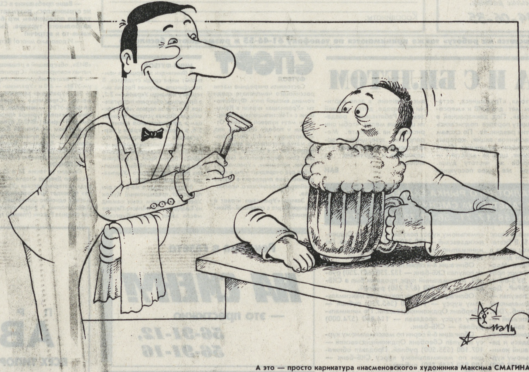
А это — просто карикатура «насменовского» художника Максима СМАГИНА

тем более что это не удалось и настоящему пилоту: из-за неисправностей «кукурузник» был оставлен на отдаленном аэродроме беспечными хозяевами из фирмы «Добруджа-эйр».