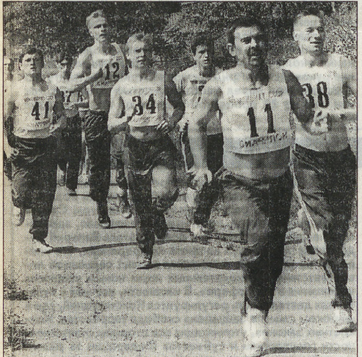
На житейских перекрестках

Наша страна — как огромная коммунальная квартира. Все люди — соседи или бывшие родственники. И мир напоминает войну, а война — запутавшийся в сонных сетях мир. Эта история — только один из портретов нашей славной России. В сладком зарубежье такого быть не могло, эта картинка — из России. Какая страна, то бишь квартира, — такие и люди.