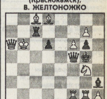
Кооп. мат в 2 хода. 2 решения.