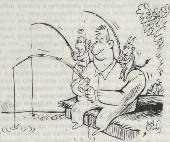
Рис. Максима СМАГИНА