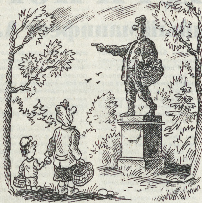
РИС. В. МИЛЕЙКО (С-ПБ)

*) Спонсор абзаца — Урал-Сибирский банк социального развития.