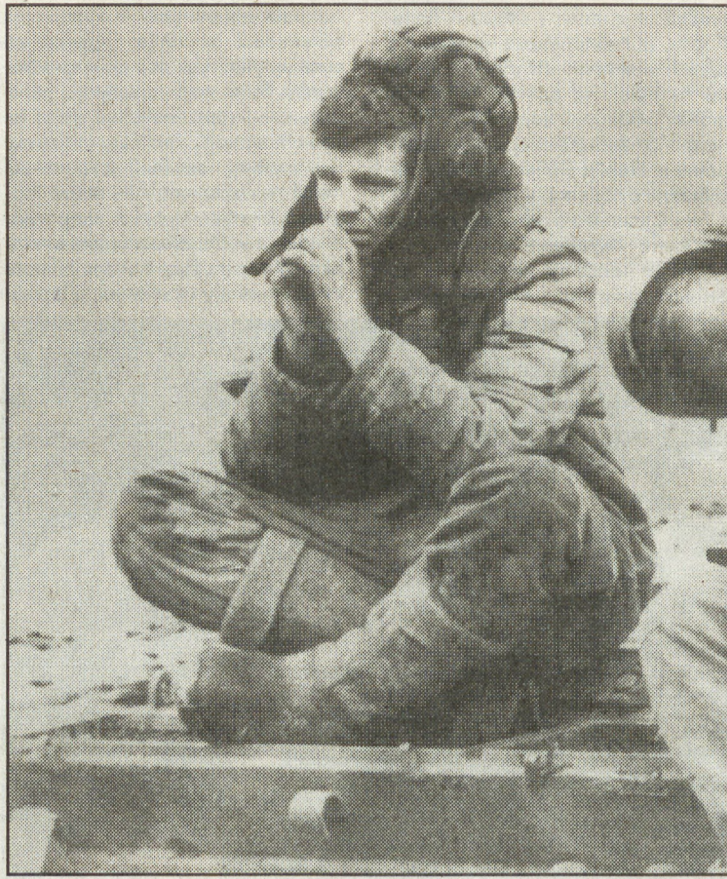
За 20 минут до штурма Серноводска