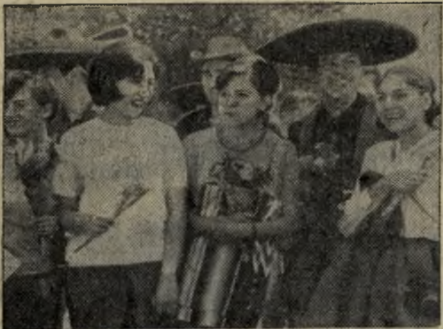
На снимке: посланцы молодежи стран Латинской Америки в столице фестиваля.