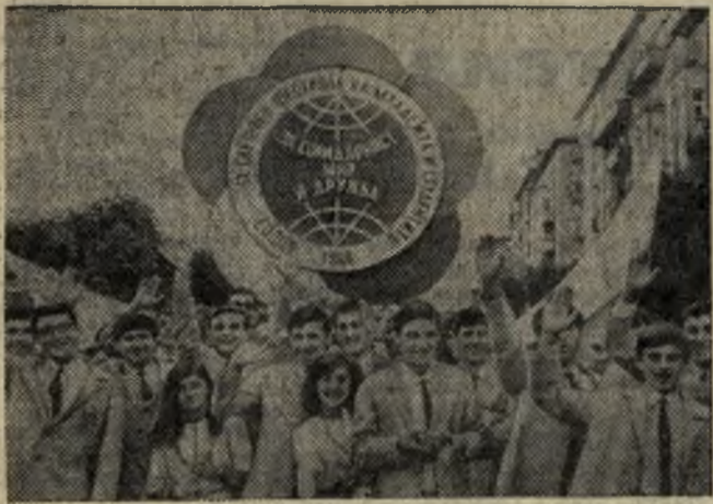
На снимке: участники фестиваля во время торжественного шествия по улицам столицы Болгарии.