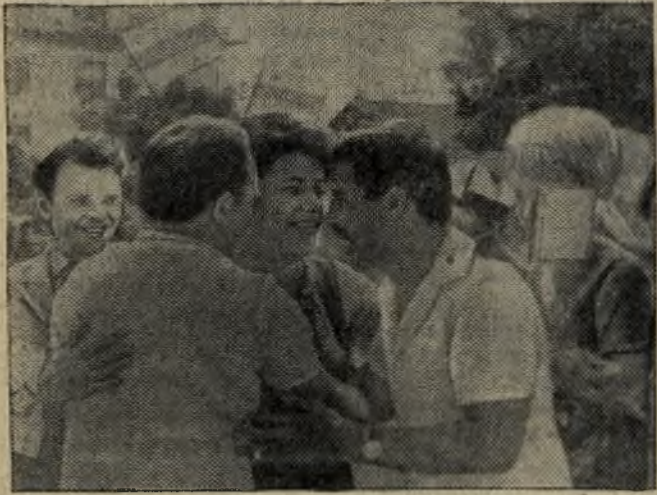
На снимке: советская делегация в столице Болгарии. Встреча давних друзей.