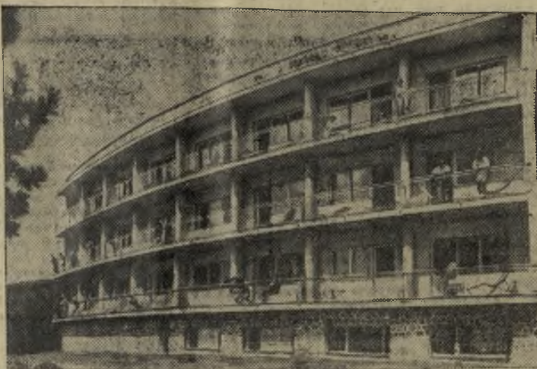
Венгерская Народная Республика. 220 тысяч трудящихся провели свой отпуск в прошлом году по путевкам профсоюзов. Возможности организованного отдыха продолжают улучшаться. В стране открываются новые здравницы, благоустраиваются действующие.

На снимке: дом отдыха в горах Мечек на юге Венгрии.