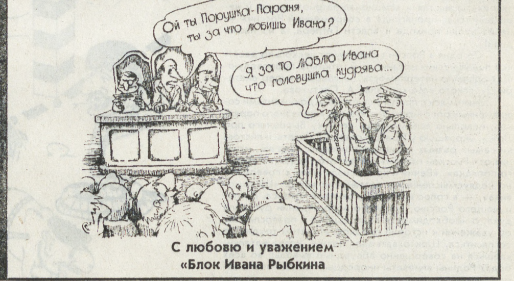
С любовью и уважением «Блок Ивана Рыбкина»

ТЕЗИСЫ, ПРИЗЫВЫ, ОБРАЩЕНИЯ 1) ПОКА ОПТИМИСТЫ УЧАТ АНГЛИЙСКИЙ. 2) ЗЕМЛЮ — КРЕСТЬЯНАМ, БАНАНЫ — ОБЕЗЬЯНАМ, МАРС — МАРСИЯНАМ, ВСЕМ СЕСТРАМ ПО СЕРЬГАМ! 3) РЫБАКИ! КРЕПЧЕ ДЕРЖИТЕ УДОЧКИ! 4) ХОЗЯЙКИ И ДОМОХОЗЯЙКИ! СМЕЛЕЕ ВВОДИТЕ