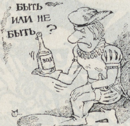
Рис. М. СМАГИНА