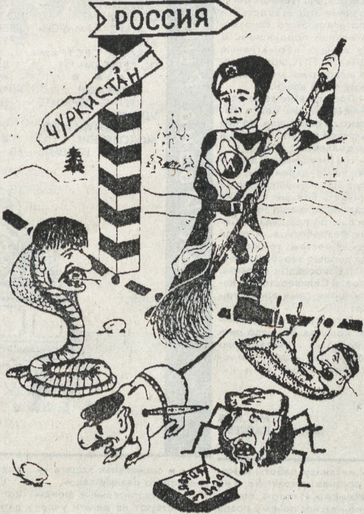
Очистим страну от мафиозной орды! Орзынцы — вон Россия — для россиян!